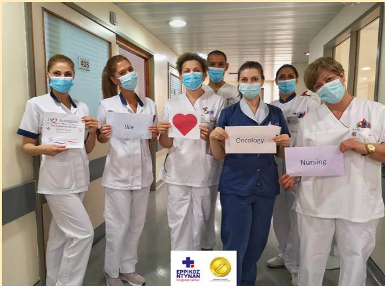
Ερρίκος Ντυνάν Hospital Center Τμήμα Ημερήσιας Νοσηλείας – Χημειοθεραπειών

Ευχόμαστε σε όλους τους Ογκολογικούς Νοσηλευτές Χρόνια Πολλά με αγάπη και σεβασμό στον Ογκολογικό Ασθενή!