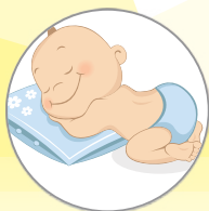
— Παράτριμμα (Σύγκαμα)