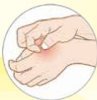
— Κνησμός (Φαγούρα)