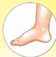
— Οίδημα - Πόνος