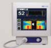
BIS™ Brain Monitoring