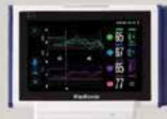
INVOS™ Cerebral/Somatic Oximetry