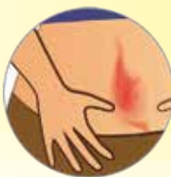
— Εξάνθημα (Κοκκινίδια)