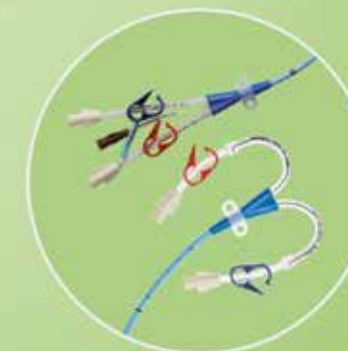
Straight and YouBend Acute Dialysis Catheters

Arrow, a unique source of innovative devices