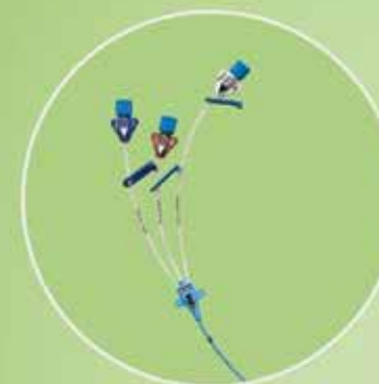
Central Vein Catheters