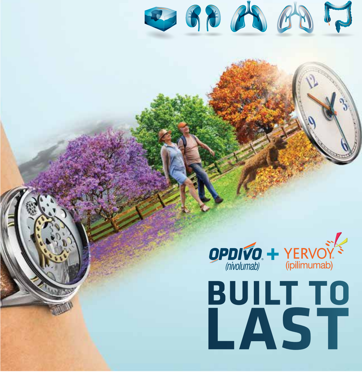
Περίληψη Χαρακτηριστικών Προϊόντος OPDIVO, Ημερησμία αναθεώρησης κείμενου, 27 Οκτωβρίου 2022.

Βοηθήστε να γίνουν τα φάρμακα πιο ασφαλή και Αναφέρετε ΟΛΕΣ τις ανεπιθύμητες ενέργειες για ΟΛΑ τα φάρμακα Συμπληρώνοντας την «ΚΙΤΡΙΝΗ ΚΑΡΤΑ»