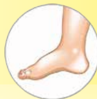
Οίδημα από φλεγμονή 1